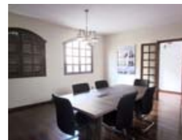
Sala de reunião