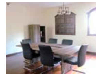
Sala de reunião