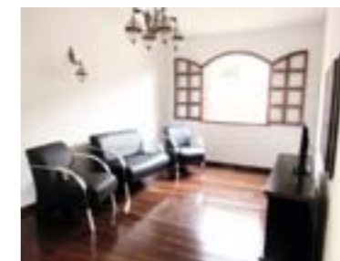
Sala de TV